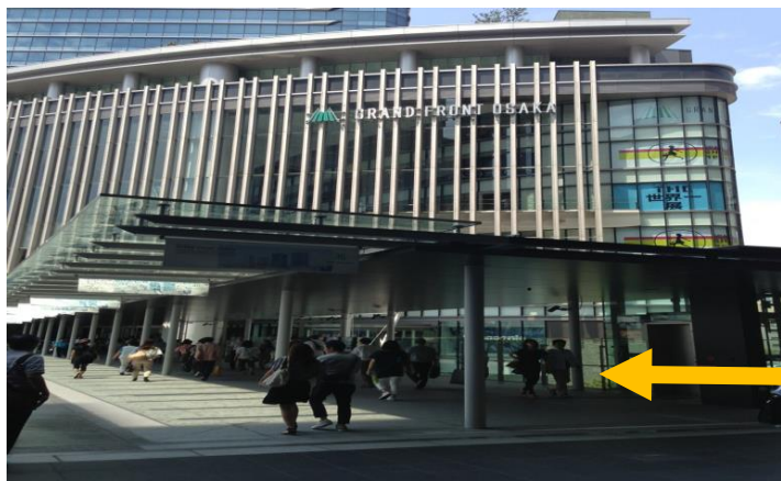
▲① グランフロント大阪(南館)へつながる2階連絡デッキ

※上図の数字と下の写真番号は対応しておりますのでご参考にいただけますと幸いです。