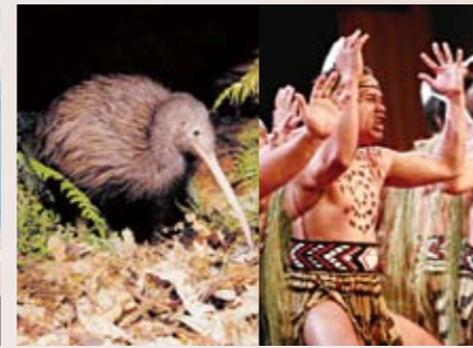
6 ロトルア 国鳥のキウィ見学やマオリダンスショーをご覧いただけます。