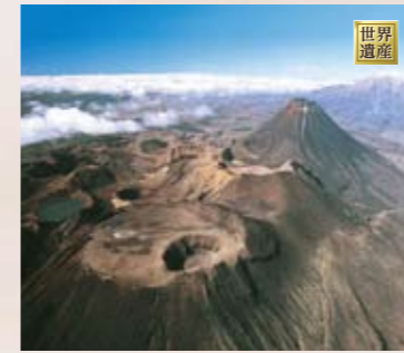
7 トンガリロ国立公園 「山の貴婦人」と称される高級リゾートシャトー・トンガリロでの昼食をご用意。