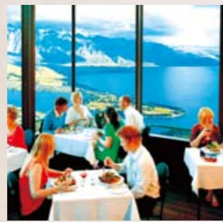
4 クイーンズタウン クイーンズタウンにある展望レストランで昼食。