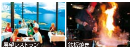
展望レストラン 鉄板焼き

●共通のご案内はP.5をご参照ください(出発前に必ずお読みください)。*運航スケジュールは、平成26年6月10日現在の運航スケジュールとなります。*行程中に最大3か所の土産物店へご案内します。これは物品の購入を強制するものではなく、ご案内できない場合も、変更補償金の対象とはなりません。*写真は全てイメージです。