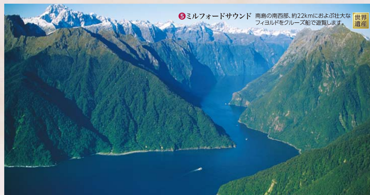
5 ミルフォードサウンド 南島の南西部、約22kmにおよぶ壮大なフィヨルドをクルーズ船で遊覧します。