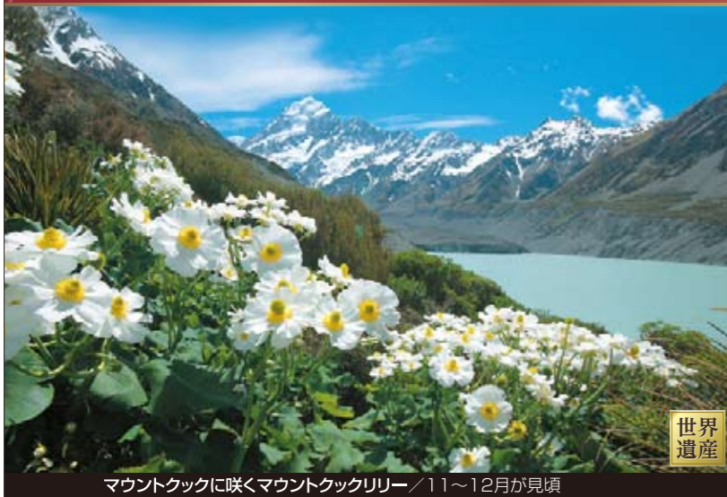
マウントクックに咲くマウントクックリリー / 11~12月が見頃

11・12月は花、1・2月は良き晴天率! 雄大な大自然を厳選の観光と 2連泊・3連泊で巡る旅