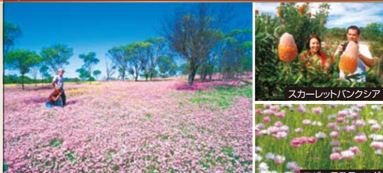
スカーレットバンクシア