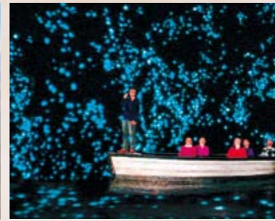
8 ワイトモ鍾乳洞 水をたたえた洞窟にボートで漕ぎ出し、幻想的な光を放つ土ポタルを見学。