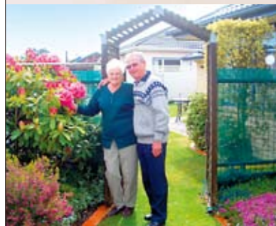
1 クライストチャーチ 一般の家庭を訪問し、庭園を見学したり、お食事をいただいたりします。