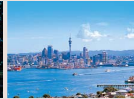
9 オークランド ニュージーランド北島北部に位置するニュージーランド最大の都市。