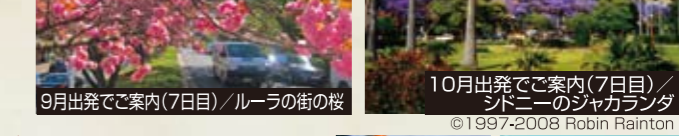
9月出発でご案内(7日目) / ルーラの街の桜