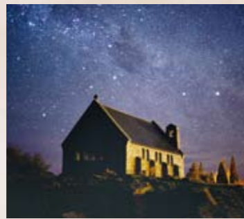
2 テカポ湖の星空 世界遺産申請中の美しい星空。※星空は天候によりご覧頂けない場合があります。